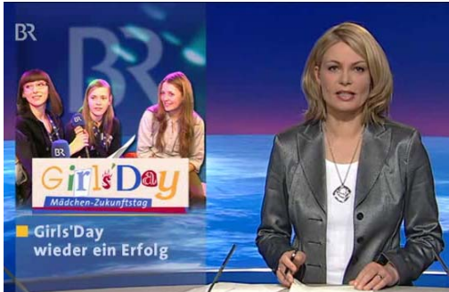
BR Rundschau, 14.04.2011

„Typische Männerberufe gibt es immer weniger. Ein Grund dafür ist ja vielleicht auch der Girls'Day, der heute wieder stattfand. Mädchen durften in technische Berufe wie Toningenieur reinschnuppern, zum Beispiel auch beim Bayerischen Rundfunk.“