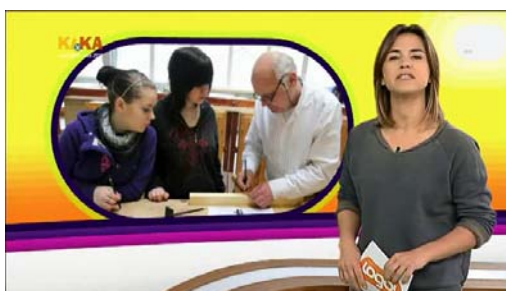
ZDF-tivi/KI.KA logo!, 14.04.2011

„Girls'Day auch bei der Bundespolizei in Magdeburg: 30 Schülerinnen haben bei der Hundestaffel zugeschaut.“