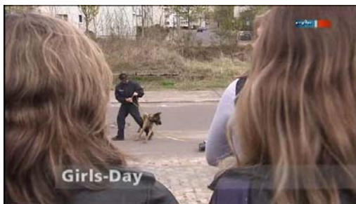
mdr sachsen-anhalt – heute – kompakt, 15.04.2010

„Typische Männerberufe gibt es immer weniger. Ein Grund dafür ist ja vielleicht auch der Girls'Day, der heute wieder stattfand. Mädchen durften in technische Berufe wie Toningenieur reinschnuppern, zum Beispiel auch beim Bayerischen Rundfunk.“